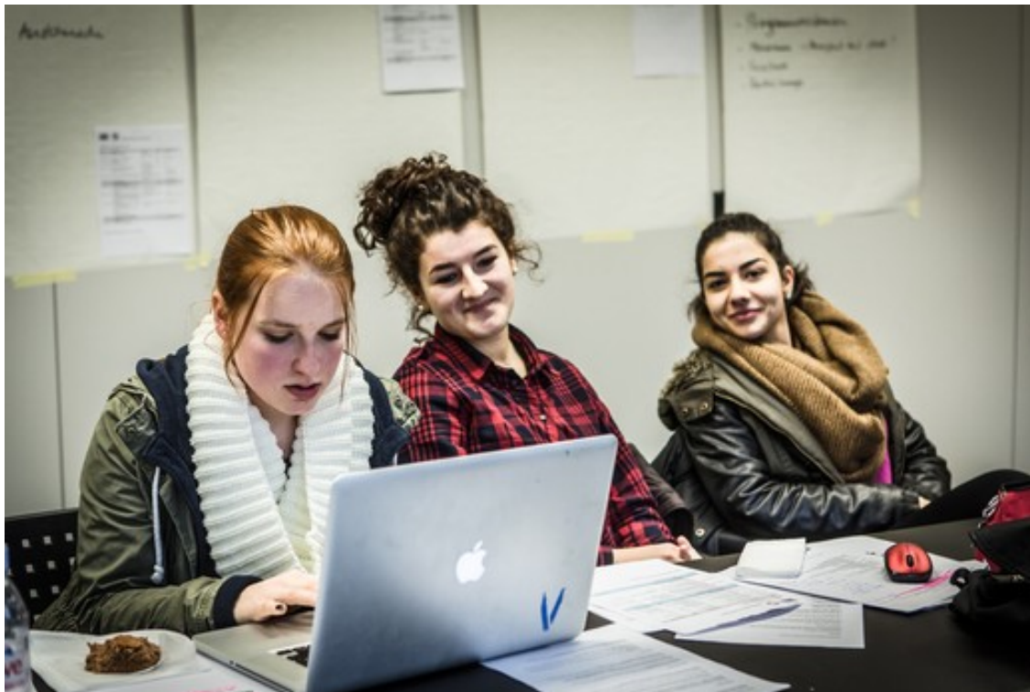
Letzter Schliff, bevor es auf Sendung geht